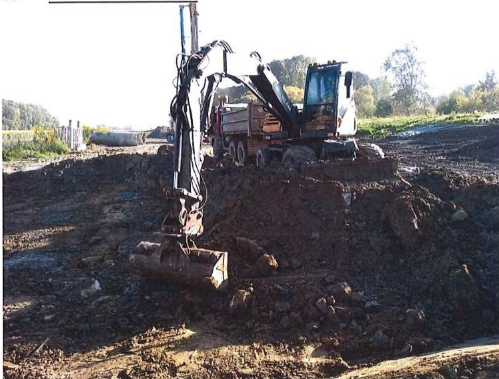
Výkop pre potreby zaradenia štetovnic - pilier č.1 na strane SK