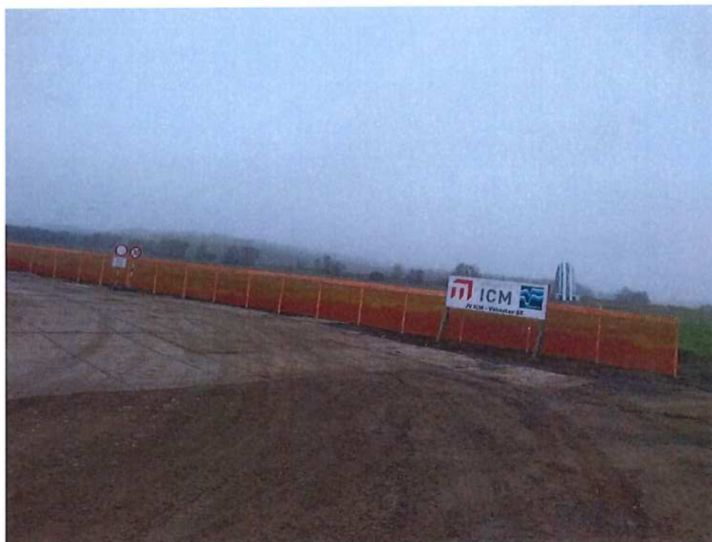
Bezpečnostné prvky okolo prístupovej cesty a výkopov