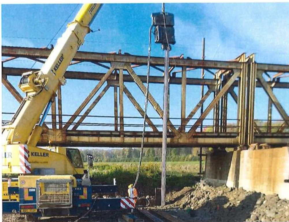
Pokračovanie baranenia štetovnic - pilier č.1 na strane SK