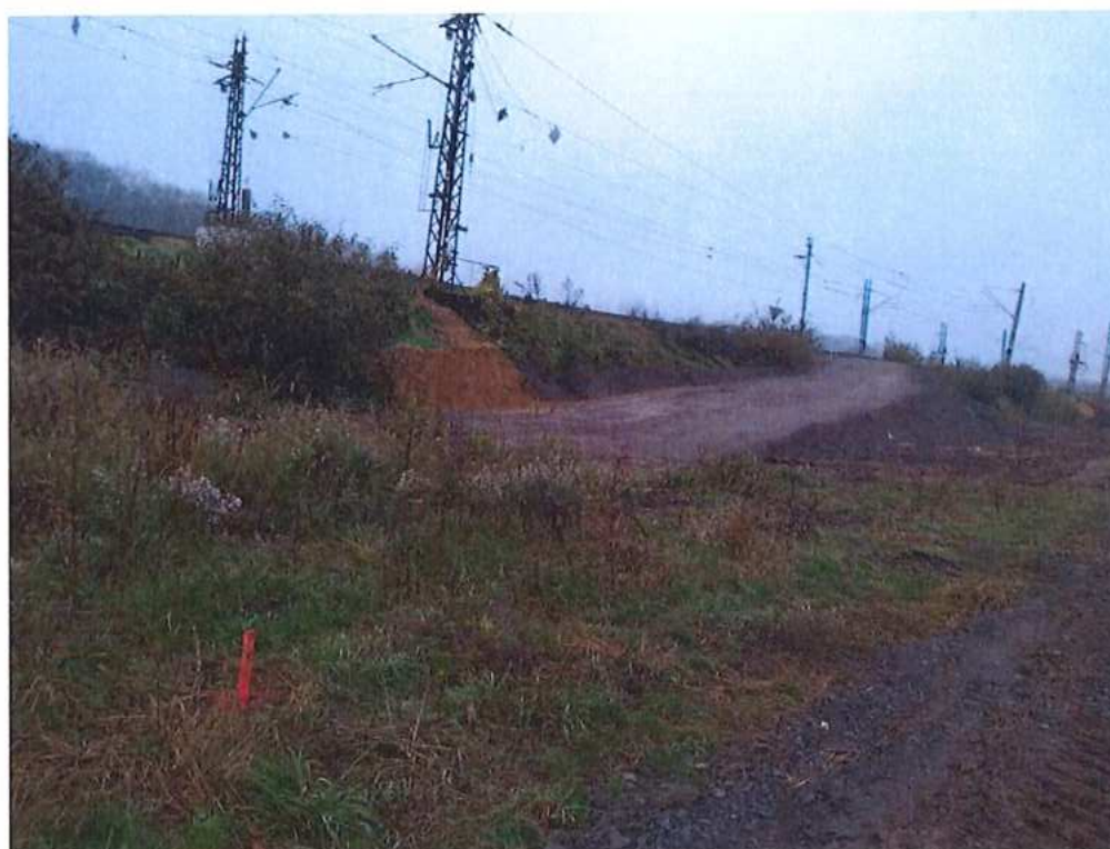
Vybudovanie nájazdovej rampy ku koľaji č.2 v km 74,000