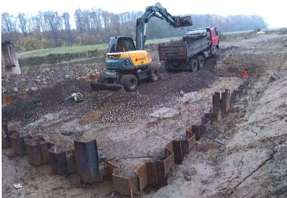
Výkopové práce v larsenovej obohrádzke - pilier č.1 na strane SK