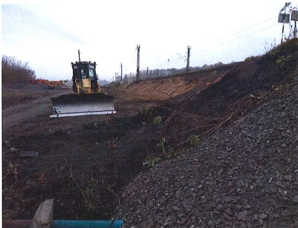
Budovanie zemného telesa pri koľaji č.2 v km 74,130-74,230