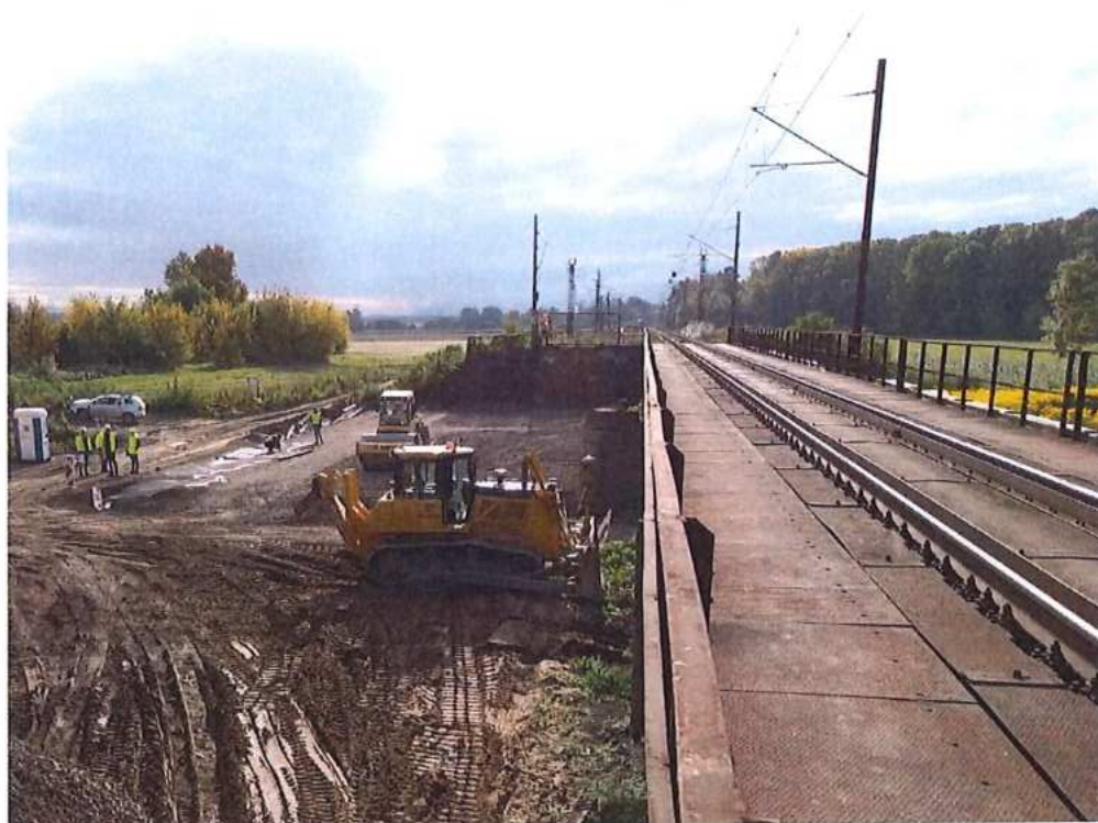
Budovanie nového násypu v mieste bývalého predmostia - koľaj č.2