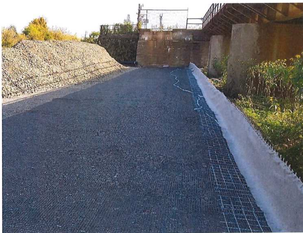
Budovanie nového násypu v mieste bývalého predmostia - koľaj č.2