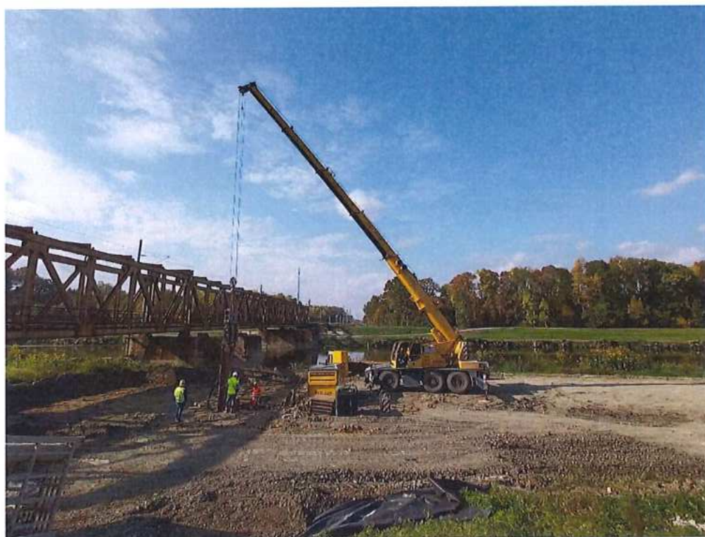
Zahájenie baranenia štetovnic - pilier č.1 na strane SK