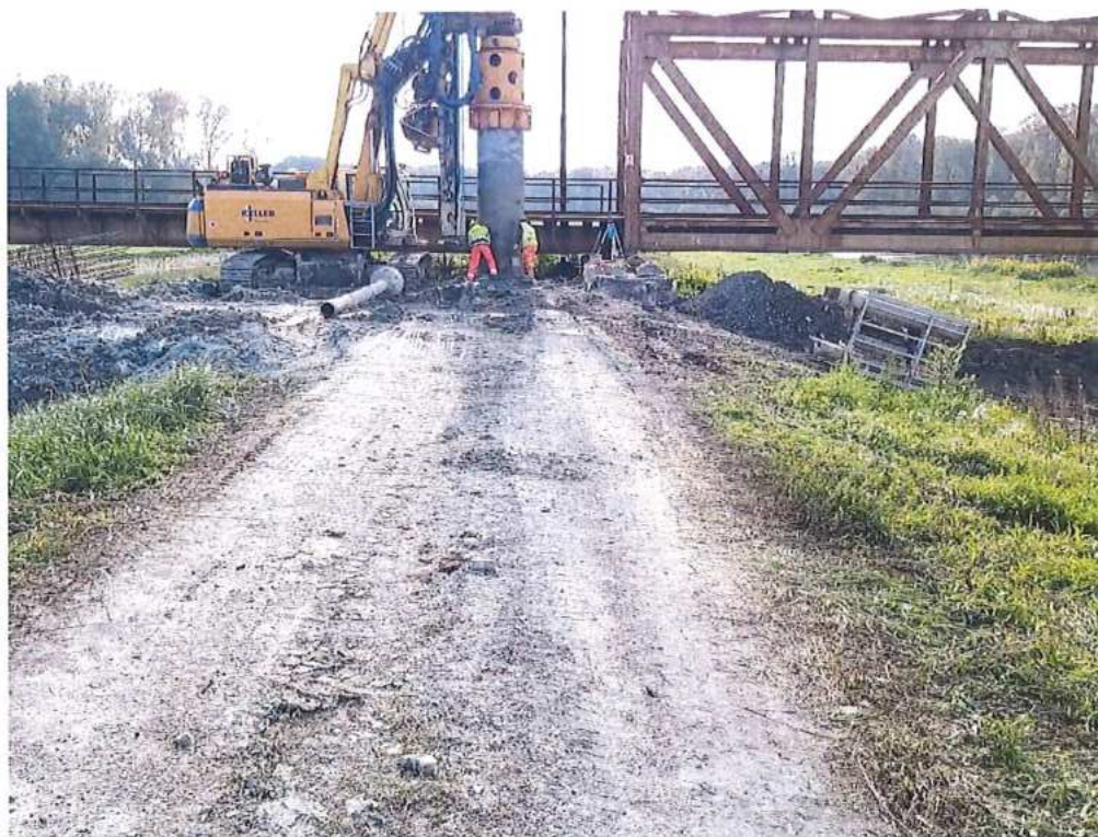
Vŕtanie pilót - opora č.1 na strane SK